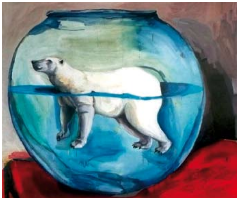
Mathieu Cherkit - « sans titre » huile sur toile

Le Salon investit les deux niveaux du Théâtre de Montrouge, pour une mise en valeur optimale. Chacun peut, au gré de son humeur et de ses sensibilités artistiques, réaliser son propre parcours