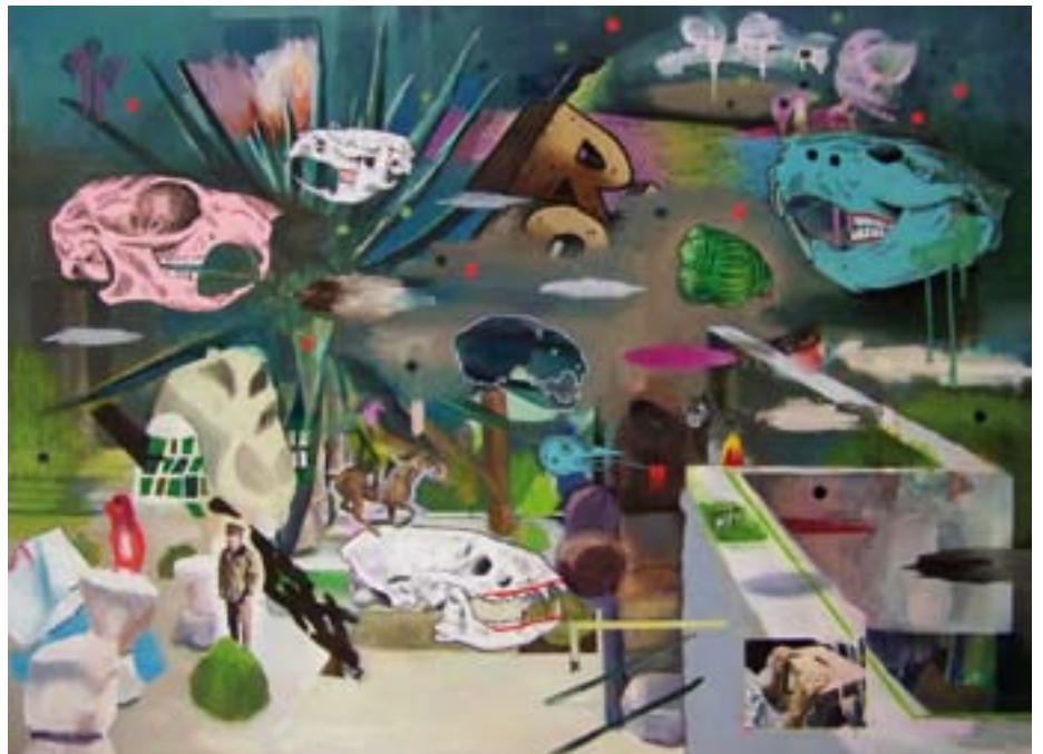
Sophie Pouvreau - « Le Site de l'attaque hier »

Alain Lamaignère a étudié avec soin 900 dossiers de candidatures, avant de choisir les créateurs les plus représentatifs des nouvelles tendances. Un succès qui montre bien la vitalité et la richesse de notre jeune création.