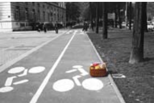
Eugénie Stéphanie Leight - photographie